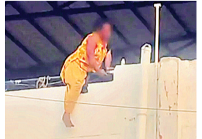
हरिभूमि न्यूज | बैतूल