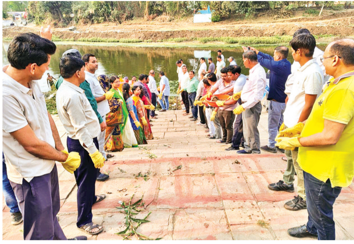
हरिभूमि न्यूज ▶▶ हरदा