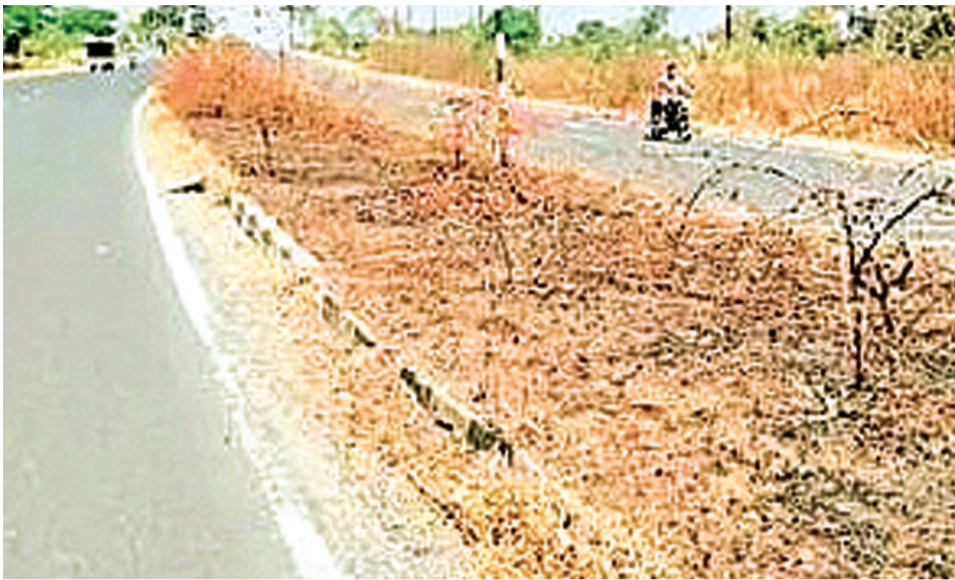
हरिभूमि न्यूज | बैतूल

बैतूल से इटारसी तक बने 51 किमी फोरलेन सड़क के बीच डिवाइडर पर पौधे लगाये गये थे। लेकिन देखरेख और तराई के अभाव में यह पौधे एक साल में ही सूख गये। इन पौधों की देखरेख और मटेनेंस का ठेका जितेन्द्र सिंह एंड कंपनी को सौंपा गया था।